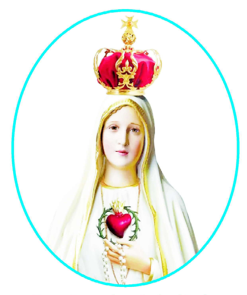
Happy Feast of our Lady of Fatima