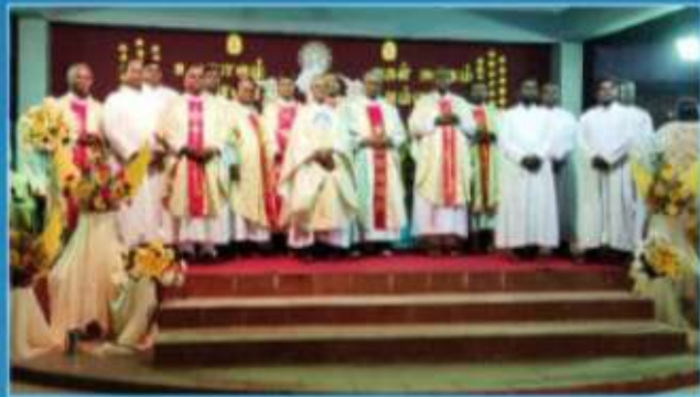
தூய உலகமாதா ஆலயம் பொன்விழா ஆண்டு 1972-2022 புதுவையில் உள்ள புதிய கெலி