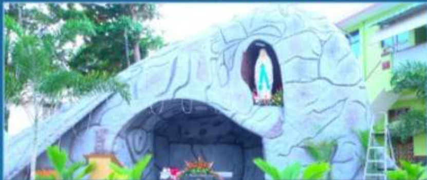
பொன்விழா ஆண்டு நினைவாக தூய ஜார்ஜ் அன்னையின் புதிய கெலி